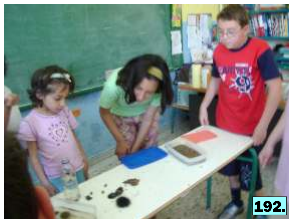
φωτογραφίες 180-192: Τα παιδιά παρατηρούν τα ζώα του βυθού της θάλασσας.

Στη συνέχεια του προγράμματος και ολοκληρώνοντας τις εντυπώσεις μας από την επίσκεψή μας στη λίμνη του Μόρνου, αναφέραμε την αναγκαιότητα του νερού στη ζωή μας και τις επιπτώσεις της απουσίας του. Προβληματιστήκαμε και σκεφτήκαμε τι θα συνέβαινε αν ο νομός μας δεν είχε αυτήν τη λίμνη, η οποία τροφοδοτεί όλο το λεκανοπέδιο Αττικής.