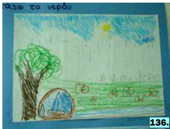
φωτογραφίες 127-136: Τα έργα των παιδιών στην έκθεση ζωγραφικής, με θέμα «Ακούω, αισθάνομαι, ζωγραφίζω», στα πλαίσια του Μουσικού Φεστιβάλ.