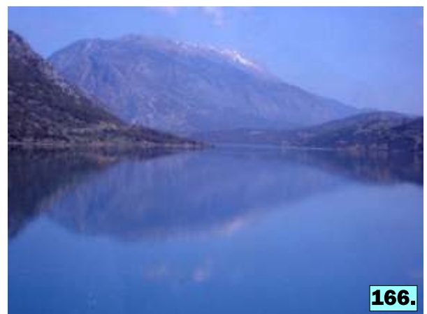
φωτογραφίες 159-166: Τα παιδιά κοντά στη λίμνη του Μόρνου. Οι δύο πλευρές της λίμνης που σχηματίζονται από το πρόφραγμα.

Έπειτα επισκεφθήκαμε την πλατεία του χωριού Λιδορίκι, όπου τα παιδιά κάθισαν να δροσιστούν δίπλα στη βρύση της και ζωγράρισαν τις εντυπώσεις τους από τη λίμνη του Μόρνου στα μπλοκ που τους μοιράσαμε (βλ. παράρτημα παραδοτέων).