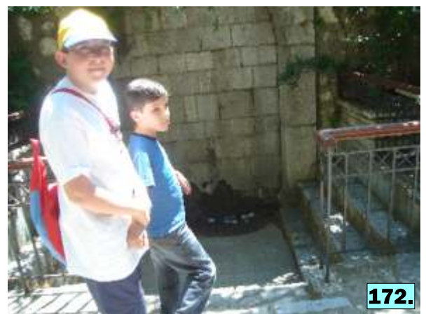
φωτογραφίες 167-172: Τα παιδιά ζωγραφίζουν στην πλατεία του Λιδορκίου.

Στην επιστροφή, είπαμε τραγούδια με θέμα το νερό και διαλέξαμε διαφορετική διαδρομή για να παρατηρήσουμε την παράκτια περιοχή του νομού μας. Έτσι, τα παιδιά είδαν τις ακρογιαλιές του Γαλαξιδίου και της Ιτέας καθώς και τα διάφορα νησάκια του Κορινθιακού κόλπου.