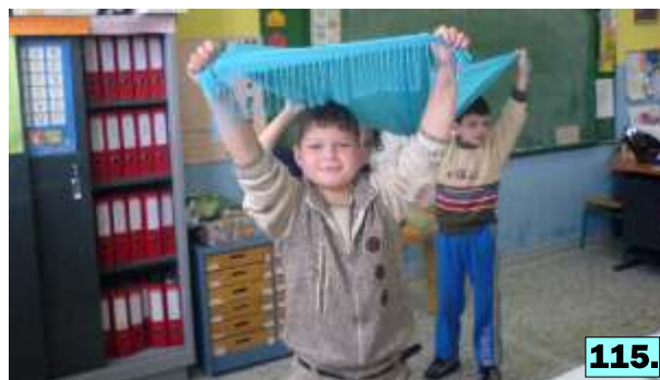
φωτογραφίες 112-115: Πρόβα του μουσικοκινητικού τραγουδιού «Σύννεφα μικρά».

Τα παιδιά δραματοποίησαν τον Κύκλο του Νερού τραγουδώντας το μουσικοκινητικό τραγούδι «Σύννεφα μικρά» (βλ. παράρτημα παραδοτέων). Ακόμη, χόρεψαν και τραγούδησαν το δημοτικό τραγούδι « Η Νεραντζούλα » (συρτό στα τρία), που αναφέρεται στις δραστηριότητες των γυναικών με το νερό (βλ. παράρτημα παραδοτέων). Η έντονη προθυμία και η χαρά της συμμετοχής στην εκδήλωση ήταν έκδηλη.