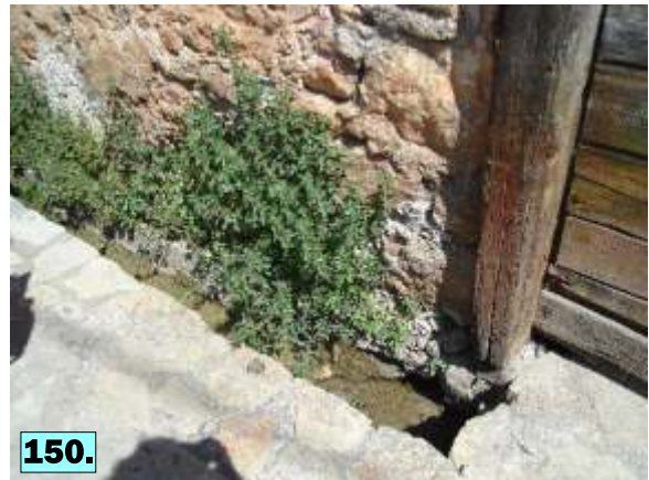
φωτογραφίες 145-150: Τα παιδιά παρατηρούν τα αυλάκια νερού στην περιοχή Ταμπάκινα.

Ακολούθησε επίσκεψη στην παραδοσιακή βρύση στην είσοδο του κάστρου της Άμφισσας. Κάτω από τον πλάτανο οι μαθητές κολάτισαν και δροσίστηκαν με το νερό της βρύσης.